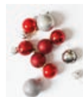
Décorations de Noël abîmées (boules, guirlandes,...)