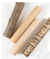
Papiers cadeau fabriqués avec du papier recyclé