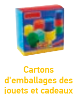
Cartons d'emballages des jouets et cadeaux